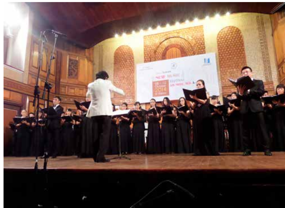
Hanoi National Opera Choir under opførelsen af mit værk A Clear Midnight

fra Asien og Europa i Hanoi, Vietnam. Stykket, jeg var blevet udvalgt med, var mit korværk "A Clear Midnight", skrevet for dobbeltkor, altså to gange fire stemmer. Det var oven i købet sådan, at jeg blev inviteret med alt betalt i de fem dage, festivalen varede, så her først i oktober tog jeg til Vietnam. Det blev nogle meget spændende og tætpakkede dage med mange koncerter med meget spændende, men også udfordrende musik. Fredag aften d. 10/10 blev mit værk opført af Hanoi National Opera Choir, og selvom man godt kunne høre, at det med at synge i 10 min. på engelsk ikke var deres hjemmebane, så var det spændende at høre, hvordan de fortolkede min musik. Derudover bød turen på et